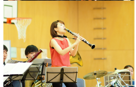
管楽器を知らう!!ワークシート

～写真を見て、楽器の名前を答えよう。また、楽器の種類がわかる楽器が、どちらのCOを塗りましょう。～